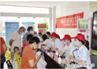
主题党日义诊活动